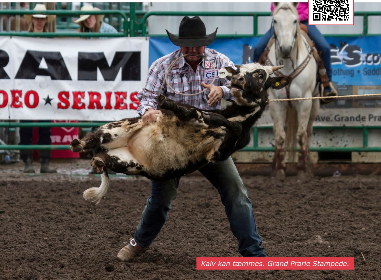
Kalv kan tæmmes. Grand Prarie Stampede.

Alle, der sidder med dette blad i hånden, har et forhold til Canada og USA. Vi har alle en historie om, hvorfor det blev disse lande, vi kastede vor kærlighed på.