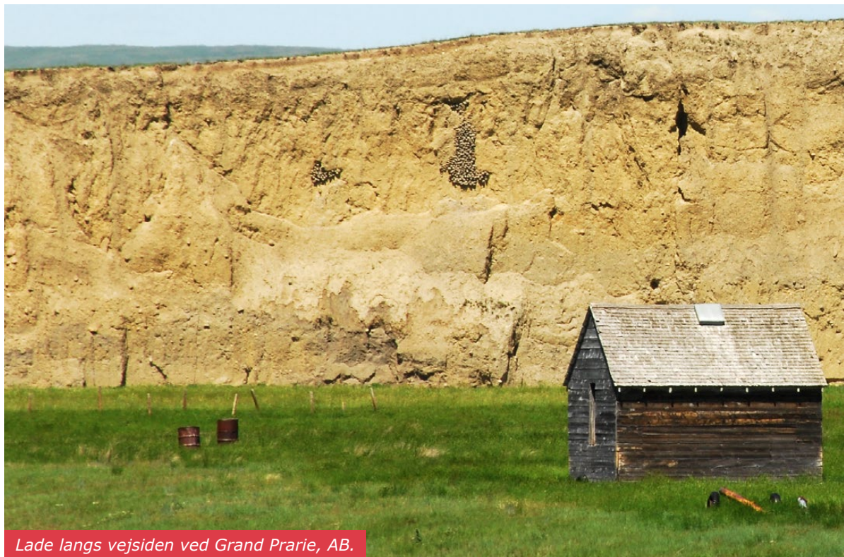
Lade langs vejsiden ved Grand Prairie, AB.

Vi boede i telt på campingpladser og lavede selv mad undervejs. Turen gik fra Calgary og hele vejen ned gennem det vestlige USA. Helt ned til Mexico og retur. Grand Canyon, Yellowstone, Las Vegas, Salt Lake City. En fantastisk tur med en fantastisk guide samt et fantastisk sammenhold.