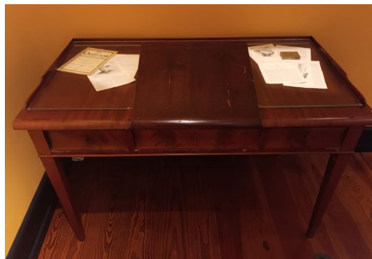
Jacob A. Riis Museum, Sortebrødregade 1, Ribe